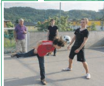
Auf dem Soccerplatz in Straßgang kann man nicht nur kicken

Für alle Musikbegeisterten ist das Explosiv am Grazer Bahnhofsgürtel ideal, um ihre Kreativität auszuleben. Man kann dort etwa mit seiner eigenen Band proben. Jugendliche aus allen kulturellen Schichten sind willkommen. Außerdem werden Workshops zu den Themen Musik, Politik und Gesellschaft angeboten.