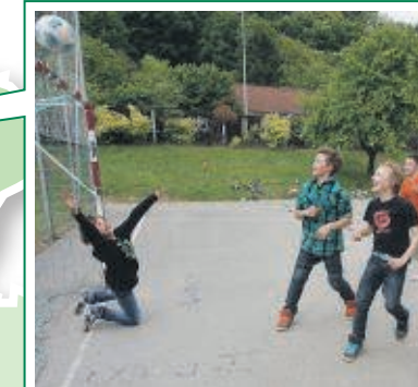
Fein, aber klein: Der Bezirkssportplatz in der Grazer Theodor-Körner-Straße

Der „Soccerplatz“ in Straßgang ist eine Anlage mit Beachvolleyballplatz, Skater-Park und drei Fußballplätzen. Auch Trinkbrunnen sind aufgestellt, um nach einem anstrengenden Kick seinen Durst löschen zu können. „Voll super“ ist für Fabian der Soccerplatz, aber: „Die Tore gehören repariert, die sind schon ganz kaputt!“ An den Wochenenden finden sich auch ältere Semester auf dem Platz.